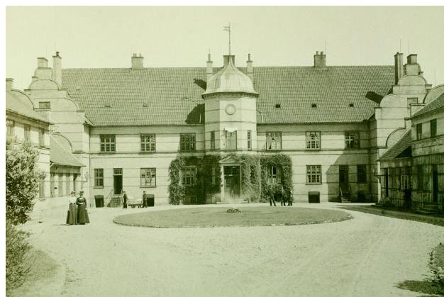
Jydske Asyl, 1902

Opgave: Gå på jagt efter klasseforskelle i de to fortællinger. Hver gang du støder på en forskel på de to patienters liv og levevilkår, så noter den i stikordsform i skemaet.